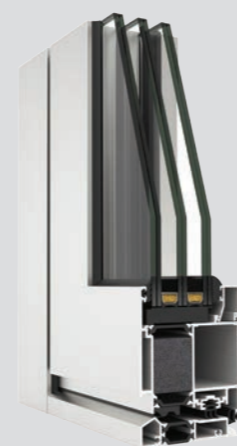
Millennium Plus 80