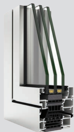
COR 80 Industrial