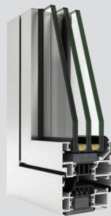
COR 70 Industrial